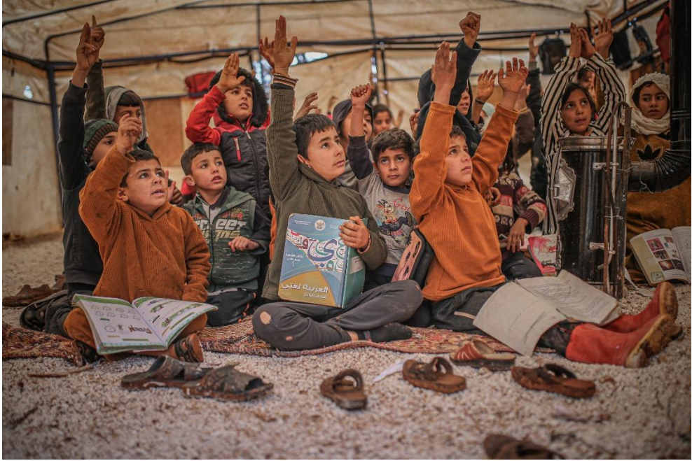
صورة توضح طريقة جلوس الأطفال لتلقي الدروس في فصل الشتاء (17)

ويزداد الوضع سوءاً في المخيمات حيث تخلو معظم المخيمات العشوائية من مقاعد أساساً، مما يضطر الطلاب للجلوس على الأرض في الشتاء مع انخفاض درجات الحرارة.