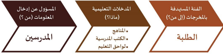
الشكل (3) يوضح الآلية التي تتم من خلالها معالجة المعلومات التعليمية

وبخصوص الفجوات المرتبطة بالمدرسين، تعاني كلا المنطقتين من نقص المؤهلات التربوية عند المدرسين، ونقص بعض الاختصاصات العلمية، كما يتناقص عدد المعلمين عموماً في المخيمات. كما يتم انتقال المدرسين بشكل دائم بسبب حركة النزوح، أو غيابهم عن القسم الأكبر من الدوام المدرسي بسبب الظروف المعيشية، إضافة إلى الفوضى الأمنية وما تسببه من خوف عند المعلمين من الجهات العسكرية وأصحاب النفوذ. وتظهر مشكلة النقص في الكادر النسائي بين المدرسين في كلا المنطقتين. وعليه ينبغي العمل على: