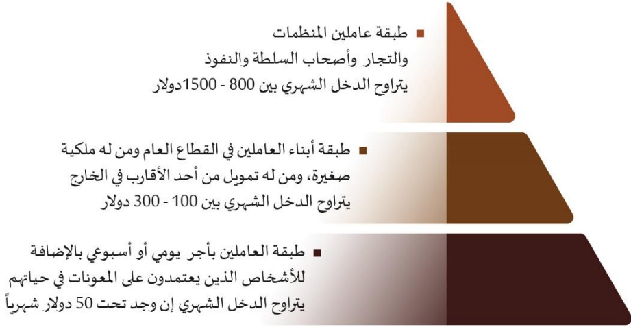
الشكل (2) يوضح طبقات المجتمع حسب الدخل الشهري بناءً على تقديرات الباحثة بعد مقاطعتها مع بيانات المقابلات مع أفراد العينة.

يوضح الشكل أعلاه وجود الاختلالات في شكل الهرم، بسبب تقلص الطبقة المتوسطة، وتداخلها مع الطبقة الفقيرة والتي تتسع باستمرار، بسبب الأزمة الاقتصادية، وعدم الاستمرار بالعمل في بعض الأحيان.